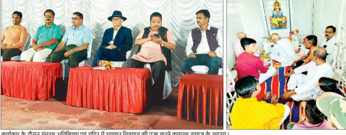
कार्यक्रम के दौरान मंचस्थ अतिथिगण एवं मंदिर में भगवान चित्रगुप्त की पूजा करते कायस्थ समाज के सदस्य।