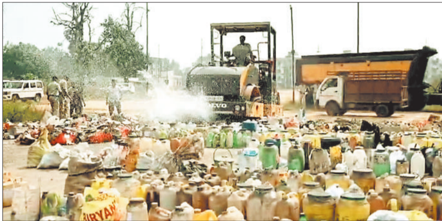
जब्त शराब की खेप में चलता बुलडोजर।