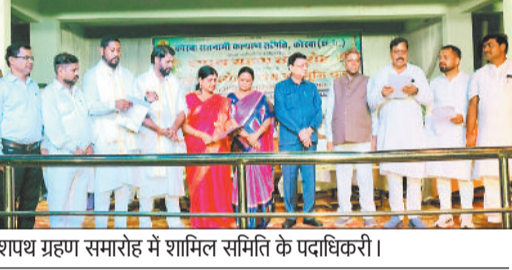
शपथ ग्रहण समारोह में शामिल समिति के पदाधिकारी।