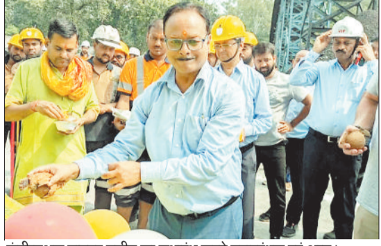
कंटीन्यूअस माइजर मशीन का शुभारंभ करते महाप्रबंधक एवं अन्य।

भूमिगत खदानों में कोयला उत्पादन को लेकर कोल इंडिया की अनुपंगी कंपनी एसईसीएल नये प्रयोग के साथ आगे बढ़ रही है। भूमिगत कोयला खनन से पर्यावरण को अधिक नुकसान नहीं होता है। कंटीन्यूअस माइजर मशीन के इस्तेमाल से 24 घंटे में अधिकतम 1000 टन कोयला निकाला जा सकता है। इसके लिए एसईसीएल कोरबा क्षेत्र के रजगामार भूमिगत कोयला