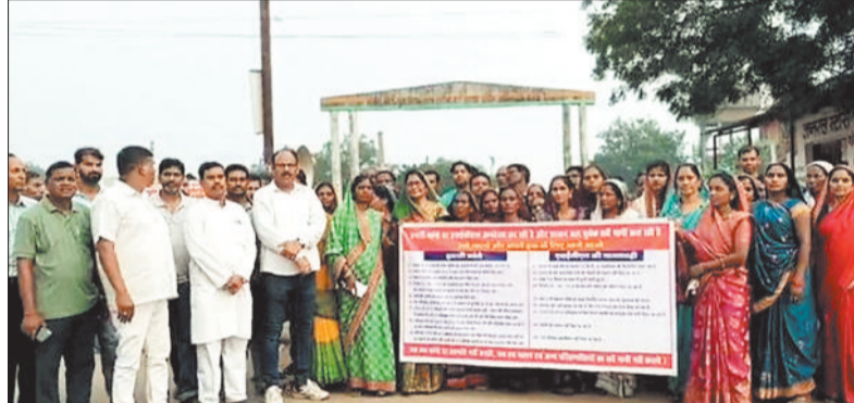
जनजागरण रैली में शामिल पूर्व विधायक एवं क्षेत्रवासी।